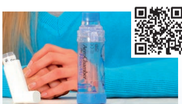
Aerochamber Plus Flow-VU® mit Mundstück (Erwachsene)