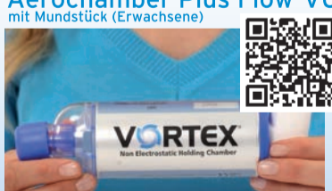
VORTEX® antistatische Inhalierhilfe mit Mundstück