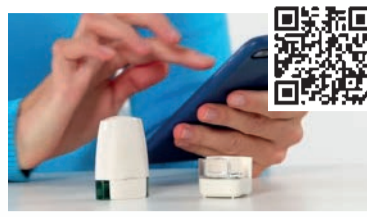
Breezhaler® mit Sensor und App