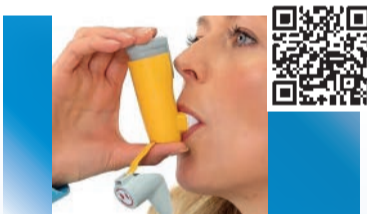
Aerosphere Inhalator (neu Mai 2022)