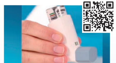
Dosieraerosol mit Zählwerk