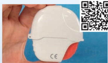
Tiotropium Glenmark Inhaler